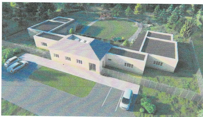
Bezpečné bydlení - vizualizace

Nedílnou součástí činnosti Světla autismu a stěžejním dlouhodobým úkolem zůstává vybudování bezpečného bydlení pro šest dětí s poruchou autistického spektra. Pro tyto účely byla, pod dozorem Krajského úřadu Moravskoslezského kraje, v roce 2022 zřízena dlouhodobá sbírka, která je jedním z pilířů financování tohoto projektu.